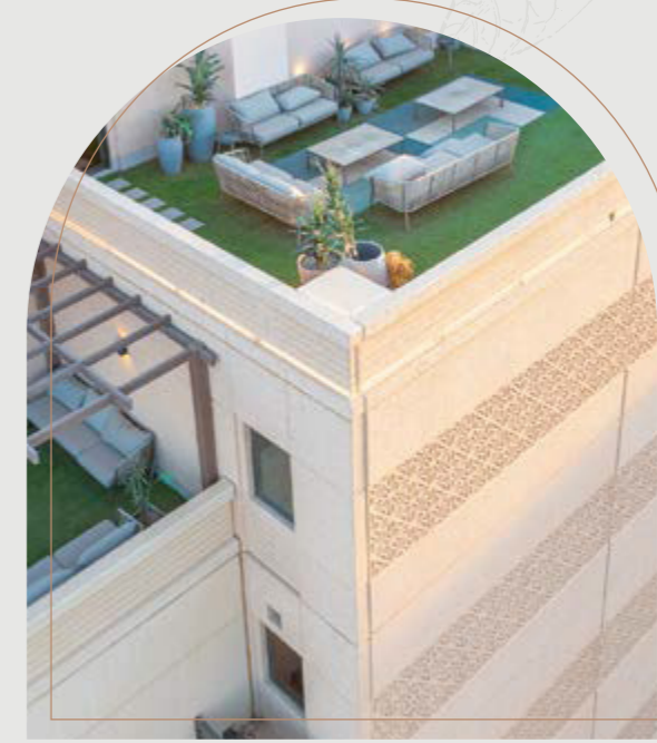
نلتزم بأدق التفاصيل العمرانية