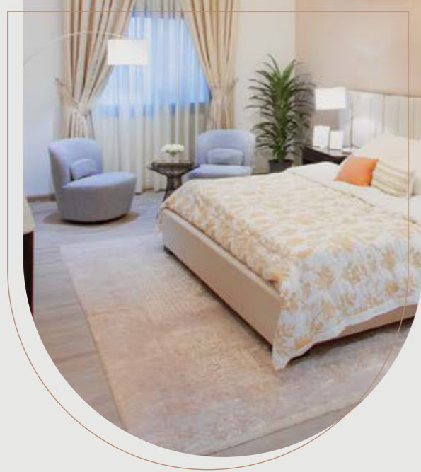
نراعي لمتطلبات ذوي الهمم