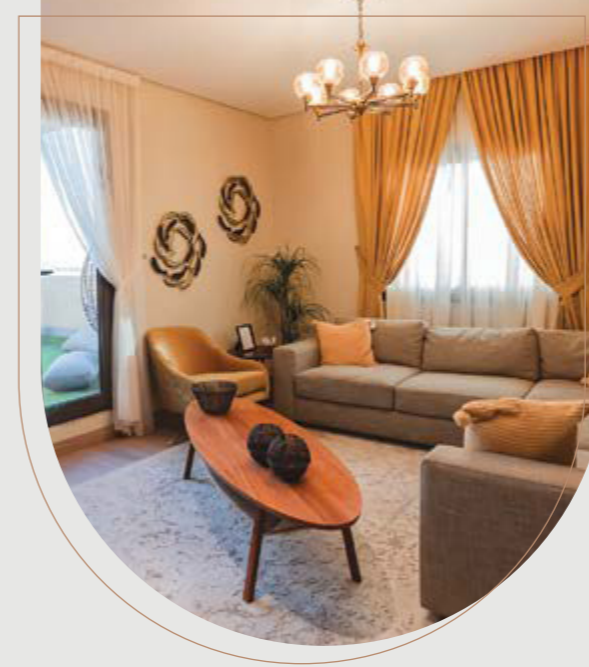
نبدع في استغلال المساحات